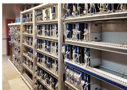
Testeinrichtung für Festnetz