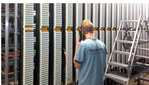
Messungen in der Zentrale

Network 41 – wir beheben Störungen, beraten und installieren.