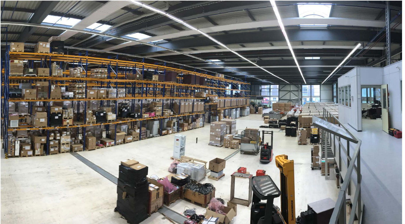
Hochregallager der VCK Logistics SCS AG in Büren